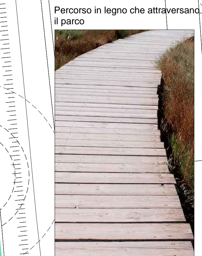
Percorso in legno che attraversano il parco