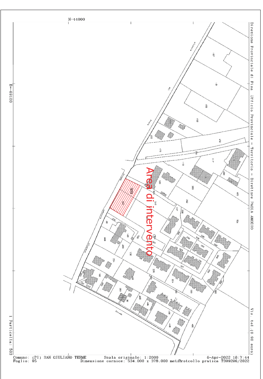
Estratto di mappa catastale Scala 1:2.000